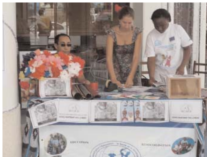
Vue du stand installé pour la campagne de Noël

D u 27 novembre au 25 décembre 2009, le MESAD a organisé sa toute première campagne de collecte de fonds privés en vue de soutenir ses actions.