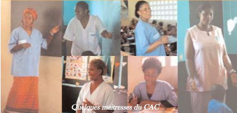
Quelques maitresses du CAC