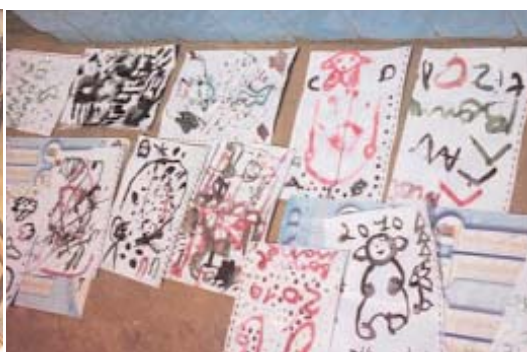
Exposition des travaux d'enfants