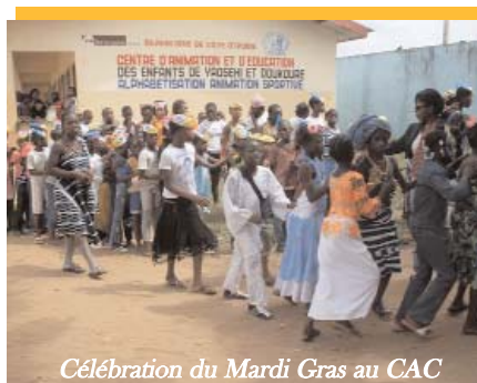
Célébration du Mardi Gras au CAC