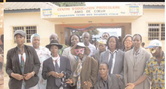
Tous prêts pour le mardi gras