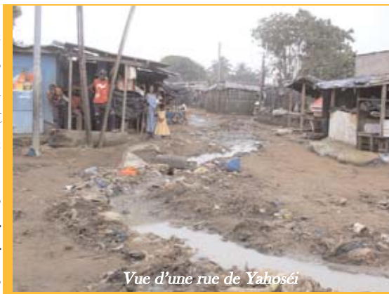
Vue d'une rue de Yaoséhi

Une autre conséquence de l'illégalité de ces quartiers réside dans le manque de complexes socioéducatif étatique. A Yaoséhi et Doukouré, les complexes sanitaires (infirmerie, centre de santé) et socioéducatifs (école, centre de formation,...) sont le fait d'association, d'ONG ou d'organisations caritatives. Ainsi, les deux quartiers comptent deux centres de santé, deux écoles et un complexe socioéducatif: le Centre Amis de Coeur.