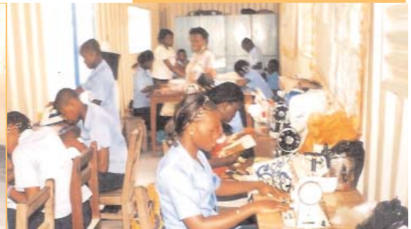
Maitresse Justine et ses élèves couturières