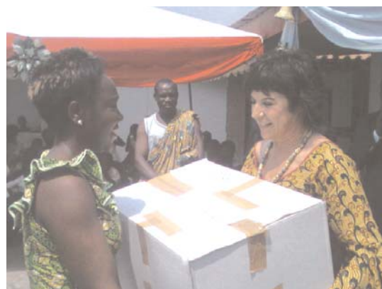
Remise symbolique de dons au MESAD par Mme Mel

Le MESAD a reçu des cartons de vêtements, de livres et des jouets pour les enfants.