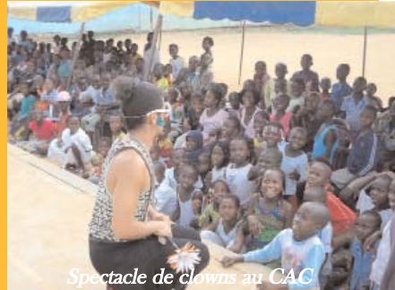
Spectacle de clowns au CAC