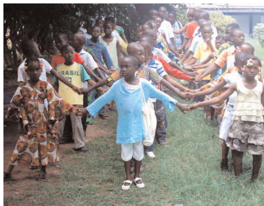
Les enfants se disciplinant dans la cour de la RTI

enfants qui ont pu se rendre compte du grand travail accompli dans les coulisses par les agents.