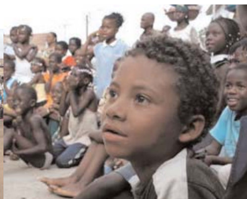
9. De la joie sur tous les visages