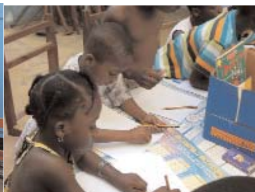
Atelier de dessin après une séance de lecture