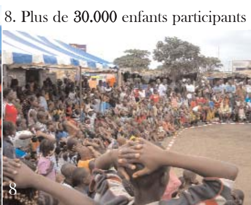
8. Plus de 30.000 enfants participants