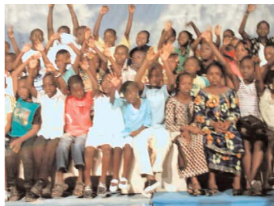
Les enfants en studio

Cette visite a été riche en connaissance pour les