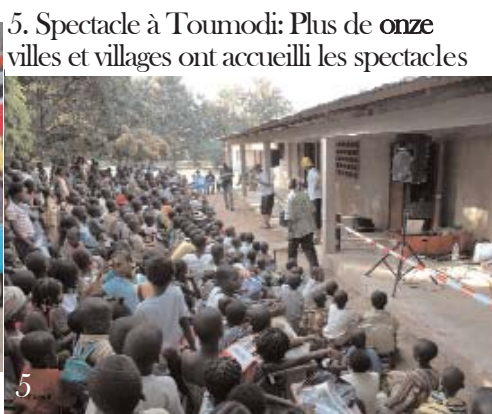
5. Spectacle à Toumodi: Plus de onze villes et villages ont accueilli les spectacles