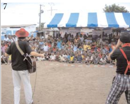
7. les enfants découvrent "petit Konan"