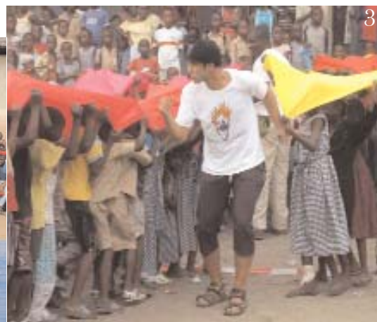
3. Les enfants apprennent de nouveaux jeux