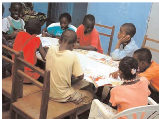
Séance de lecture individuelle

Ce fut une belle expérience que nous comptons renouveler les prochaines vacances scolaires 2010.