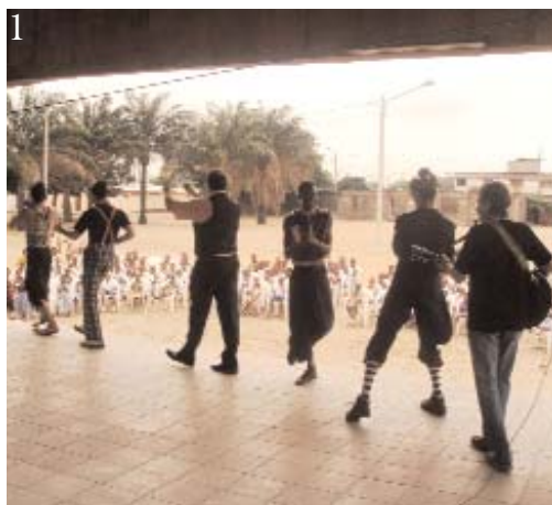
1. L'entrée sur scène des clowns