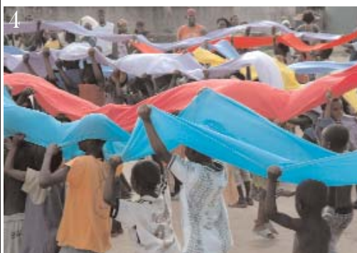
4. Les enfants bien appliqués au jeu